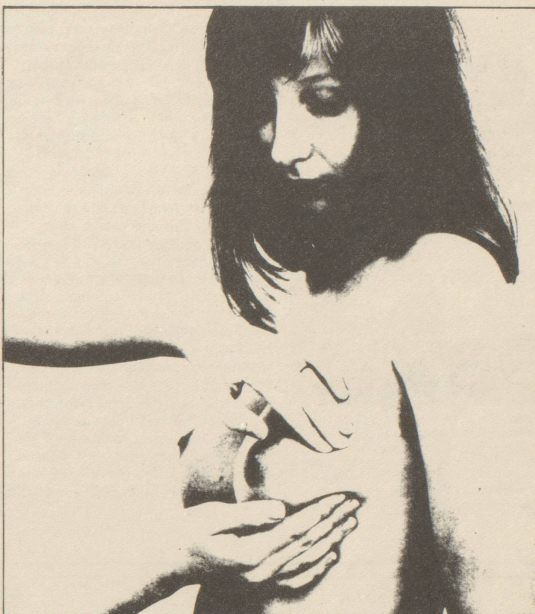
Die Brustuntersuchung kann man selber machen. Ihr Arzt soll Ihnen zeigen wie!

Viele Frauen, die den Fragebogen ausgefüllt haben, nennen Verhütungsmittel, in den meisten Fällen die Pille. Selten informieren die Frauenärzte