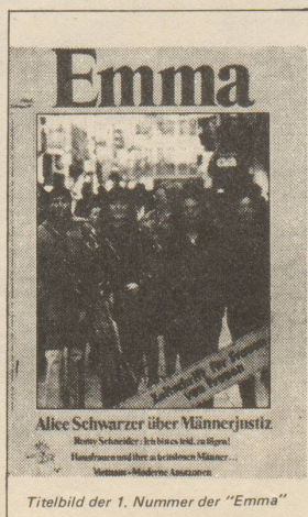
Titelbild der 1. Nummer der "Emma"

Am 26. Februar 1977 war es endlich soweit: "Emma", Alice Schwarzers seit fünf Jahren geplante "Zeitschrift für Frauen von Frauen", konnte erscheinen. Trotz der beachtlichen Startauflage von 200.000 war "Emma" noch am selben Tag vergriffen. Nochmals 100.000 Hefte wurden nachgedruckt. Die Redaktorinnen sahen ihr Konzept — ein "Massenblatt" für "Frauen aller Schichten" — aufgegangen. Andere feministische Zeitschriften eröffneten die Polemik gegen "Emma".