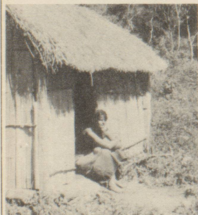
Wie leben die Paï-Indianer?

Ich habe an der Uni Ethnologie und Urgeschichte studiert mit dem Ziel, einmal in die Dritte Welt, wenn möglich nach Südamerika, zu gehen. Zuerst aus wissenschaftlichen Motiven. Nachdem ich gesehen habe, dass man Völker nicht einfach studieren kann, wenn sie gleichzeitig vor der Ausrottung stehen, habe ich mich entschlossen, einen Weg zu suchen, wie ich mein Interesse an fremden Kulturen mit einer vernünftigen Hilfe verbinden könnte. Konkret hat sich dann für mich und meinen Mann dieses Projekt in Paraguay angeboten.