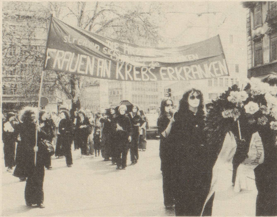
Unsere Muttertagsaktion in Zürich

Zu dieser Problematik vgl. unsere Broschüre "Lieber ein Mann und gesund als eine Frau und krank"!