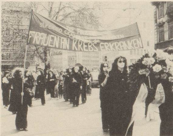
Unsere Muttertagsaktion in Zürich

Zu dieser Problematik vgl. unsere Broschüre "Lieber ein Mann und gesund als eine Frau und krank"!