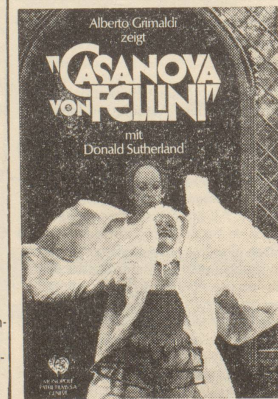
Noch einmal: Casanova

Wir Frauen in der Redaktion waren uns keineswegs einig über den Film "Casanova" von Fellini. Darum haben wir beschlossen unsere Leserinnen an der Diskussion teilnehmen zu lassen. Während wir in der Mai-Nummer der "Emanzipation" die Meinung: "der Film zeigt ein Stück Realität, er ist empfehlenswert" zu Worte kommen liessen, wollen wir jetzt einer Gegenposition Platz geben. Die Autorin sagt: "Früher war ich glühende Fellini-Verehrerin".