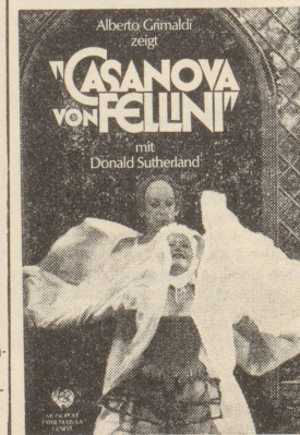
Noch einmal: Casanova

Wir Frauen in der Redaktion waren uns keineswegs einig über den Film "Casanova" von Fellini. Darum haben wir beschlossen unsere Leserinnen an der Diskussion teilnehmen zu lassen. Während wir in der Mai-Nummer der "Emanzipation" die Meinung: "der Film zeigt ein Stück Realität, er ist empfehlenswert" zu Worte kommen liessen, wollen wir jetzt einer Gegenposition Platz geben. Die Autorin sagt: "Früher war ich glühende Fellini-Verehrerin".