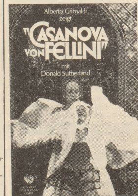
Noch einmal: Casanova

Wir Frauen in der Redaktion waren uns keineswegs einig über den Film "Casanova" von Fellini. Darum haben wir beschlossen unsere Leserinnen an der Diskussion teilnehmen zu lassen. Während wir in der Mai-Nummer der "Emanzipation" die Meinung: "der Film zeigt ein Stück Realität, er ist empfehlenswert" zu Worte kommen liessen, wollen wir jetzt einer Gegenposition Platz geben. Die Autorin sagt: "Früher war ich glühende Fellini-Verehrerin".