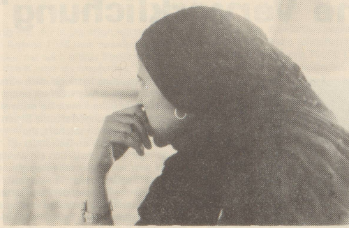
Die Begleiterin der OFRA—Delegation in der SAHARA