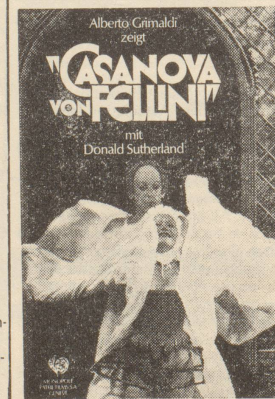
Noch einmal: Casanova

Wir Frauen in der Redaktion waren uns keineswegs einig über den Film "Casanova" von Fellini. Darum haben wir beschlossen unsere Leserinnen an der Diskussion teilnehmen zu lassen. Während wir in der Mai-Nummer der "Emanzipation" die Meinung: "Der Film zeigt ein Stück Realität, er ist empfehlenswert" zu Worte kommen liessen, wollen wir jetzt einer Gegenposition Platz geben. Die Autorin sagt: "Früher war ich glühende Fellini-Verehrerin".