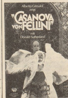
Noch einmal: Casanova

Wir Frauen in der Redaktion waren uns keineswegs einig über den Film "Casanova" von Fellini. Darum haben wir beschlossen unsere Leserinnen an der Diskussion teilnehmen zu lassen. Während wir in der Mai-Nummer der "Emanzipation" die Meinung: "der Film zeigt ein Stück Realität, er ist empfehlenswert" zu Worte kommen liessen, wollen wir jetzt einer Gegenposition Platz geben. Die Autorin sagt: "Früher war ich glühende Fellini-Verehrerin".