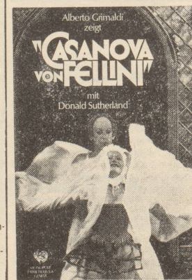
Noch einmal: Casanova

Wir Frauen in der Redaktion waren uns keineswegs einig über den Film "Casanova" von Fellini. Darum haben wir beschlossen unsere Leserinnen an der Diskussion teilnehmen zu lassen. Während wir in der Mai-Nummer der "Emanzipation" die Meinung: "der Film zeigt ein Stück Realität, er ist empfehlenswert" zu Worte kommen liessen, wollen wir jetzt einer Gegenposition Platz geben. Die Autorin sagt: "Früher war ich glühende Fellini-Verherrlerin".