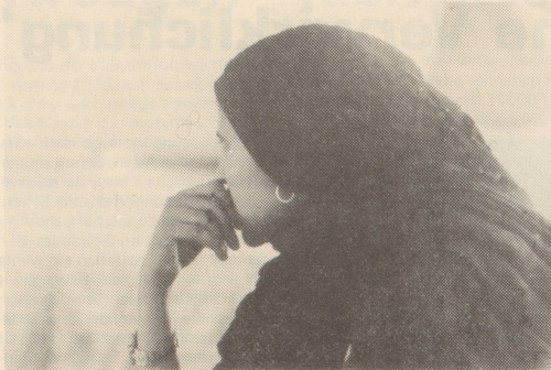
Die Begleiterin der OFRA—Delegation in der SAHARA

Mana und allen Sahrauis, mit denen wir sprachen, geht es um viel mehr als um momentane Erfolge. Sie kämpfen letztlich um die Freiheit ganz Afrikas von allen imperialistischen Einflüssen. Dass hinter den mauretanischen und marokkanischen Soldaten spanische, französische und amerikanische Interessen stehen, sahen wir sehr anschaulich an den Marken des erbeuteten Kriegsmaterials,