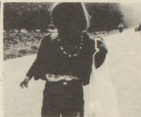
Auch dem Kind zuliebe: Guter Mutterschutz

Die Reaktionen im Zeitungswald der Linken in der Schweiz liessen nicht lange auf sich warten. Stimmen wurden laut, die den "Alleingang" der OFRA beklagten. Es wurde sogar versucht die Diskussion in der OFRA zu benutzen, um die OFRA zu spalten. Es wurde behauptet, die Mehrheit der OFRA-Mitglieder seien nicht der gleichen Meinung wie die Delegierten, die parteilosen Frauen nicht derselben Meinung wie die parteigebundenen. Will man damit innerhalb der OFRA ein Klima der Unsicherheit schaffen und eine künstliche Kluft zwischen verschiedenen Gruppen heraufbeschwören? Solche Spaltungsversuche müssen mit aller Vehemenz zurückgewiesen werden. Bisher konnten alle offenen Fragen innerhalb der OFRA loyal diskutiert werden. Es wäre schade,