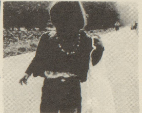
Auch dem Kind zuliebe: Guter Mutterschutz

Die Reaktionen im Zeitungswald der Linken in der Schweiz liessen nicht lange auf sich warten. Stimmen wurden laut, die den "Alleingang" der OFRA beklagten. Es wurde sogar versucht die Diskussion in der OFRA zu benutzen, um die OFRA zu spalten. Es wurde behauptet, die Mehrheit der OFRA-Mitglieder seien nicht der gleichen Meinung wie die Delegierten, die parteilosen Frauen nicht derselben Meinung wie die parteigebundenen. Will man damit innerhalb der OFRA ein Klima der Unsicherheit schaffen und eine künstliche Kluft zwischen verschiedenen Gruppen heraufbeschwören? Solche Spaltungsversuche müssen mit aller Vehemenz zurückgewiesen werden. Bisher konnten alle offenen Fragen innerhalb der OFRA loyal diskutiert werden. Es wäre schade,