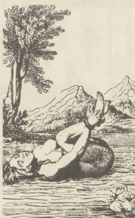
Ist sie eine Hexe?

Im Kampf gegen alte vorchristliche Bräuche und Vorstellungen verdammt die Kirche diese als heidnischen Irrglauben, als vom Teufel eingegebenen Wahnvorstellungen. Die zahlreichen Verbote (ca. 5. – 9. Jh.) gegen Zauberei, Giftmischerei, Wettermachen etc. zeigen, wie weit verbreitet solche alte Vorstellungen noch waren. Im 12. Jahrhundert bürgerte sich die Verbrennung als Strafe gegen Ketzerei in Nordfrankreich und Deutschland ein. Den Ketzern wurde Verhöhnung des christlichen Glaubens vorgeworfen und Huldigung des Teufels, Zauberei gingen einen Bund mit dem Teufel ein. Dies galt seit der Mitte des 13. Jahrhunderts als wissenschaftliche Lehrmeinung, war also bewiesen und wahr. Der Teufelspakt, der zauberische Kräfte gibt, wurde auch zum Kennzeichen der Hexe. Vereinzelt Prozesse wegen solcher Vergehen gab es zur Zeit des 'dunklen' Mittelalters, das für die Frauen wohl dunkel, aber im Vergleich zu dem, was nachher kam, noch leicht zu nennen ist. Im 16. und 17. Jahrhundert forderten dann die Hexenprozesse Millionen von Opfern, diese Opfer waren vor allem Frauen. Wie kam es zu diesem Vernichtungskampf gegenüber den Frauen?