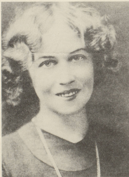
Alexandra Kollontai als junge Frau

Alexandra Kollontai studierte diese Frage ausführlich. Resultat war ein 600 Seiten umfassendes Buch "Mutterschaft und Gesellschaft". Dieses Buch bildete die Grundlage für das 1917 von der Sowjetregierung verabschiedete Sozialversicherungsgesetz. Hauptaugenmerk legte A. Kollontai bei ihren Entwürfen darauf, dass einerseits die Mutterschaft finanziell und materiell abgesichert sein müsse, darüber hinaus aber versucht werden sollte, "die Existenzbedingungen und die Lebensweise der Frauen so zu verändern, dass die Frauen unter den günstigsten Voraussetzungen ihre Kinder zur Welt bringen, und die Kinder ausserdem die notwendige Fürsorge und Pflege erhalten, die ihre Gesundheit und Entwicklung garantiert". Im Interesse der Frauen und im Interesse der Arbeitskräfte benötigten jun-