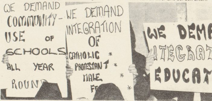
Auf Plakaten fordern irische Frauen die Aufhebung der nach Konfession und Geschlechtern getrennten Schulbildung

Nur verhältnismässig wenige Frauen erlangen