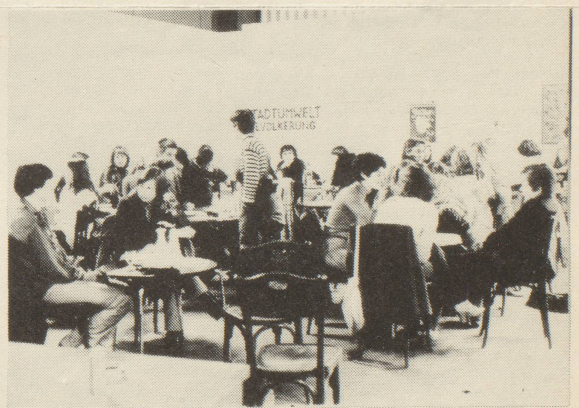
Frauen unter sich

"wir (frauen) wollen nicht bestehende kunststrichungen verändern, da wir uns dort männlichen normen anpassen müssten. andere gruppen (künstler) gehen von bestehenden aus und können im gegensatz zu uns ihre bedürfnisse und forderungen formulieren. wir nicht. unsere ausgangssituation ist anders. unsere wirklichkeit ist in den bestehenden formen (kunst und gesellschaft) nicht vorhanden, oder manipuliert. Das bild, das von männern in kunst oder werbung von uns gemacht wird, ent-