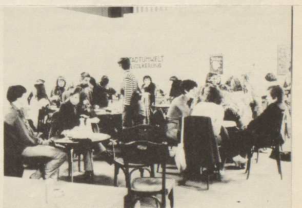
Frauen unter sich

diese zwei meinungen "es gibt nur eine kunst" und "... suche nach anderen formen der originalität" bilden auch in unserer frauengruppe den kern der oft sehr hitzigen diskussionen. auf der einen seite stand die professionelle künstlerin, für sie ist ihr werk ihre arbeit, ihr beruf, steht über dem alltagskram, ist suche nach eigenständigkeit und findet ihre orientierung an der bestehenden zeitgenössischen (avantgarde)-kunst. auf der andern seite frauen, die den begriff "kunst" ablehnen, dafür den begriff "kreativität" umso weiter fassen möchten, die alle frauen ermutigen möchten, zu versuchen, sich selbst auszudrücken, hemmungen zu verlieren, ihren alltag, ihre situation, ihren körper in ihrer arbeit auszudrücken, zu sich selbst zu finden, die "hohe kunst" zu vergessen etc. demgegenüber kam der vorwurf: dilettantismus, hobbyzeug. dazu möchte ich hier wiedergeben, was wir am seminar über kulturpolitik zum thema frauen etwa erarbeitet haben: "wir (frauen) wollen nicht bestehende kunststrichungen verändern, da wir uns dort männlichen normen anpassen müssten. andere gruppen (künstler) gehen von bestehenden aus und können im gegensatz zu uns ihre bedürfnisse und forderungen formulieren. wir nicht. unsere ausgangssituation ist anders. unsere wirklichkeit ist in den bestehenden formen (kunst und gesellschaft) nicht vorfindbar, oder manipuliert. Das bild, das von männern in kunst oder werbung von uns gemacht wird, ent-