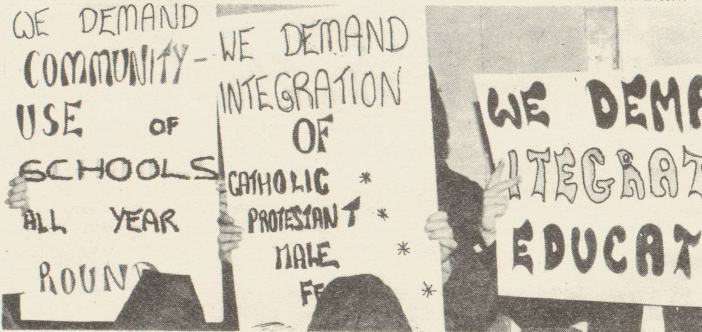
Auf Plakaten fordern irische Frauen die Aufhebung der nach Konfession und Geschlechtern getrennten Schulbildung

Nur verhältnismässig wenige Frauen erlangen