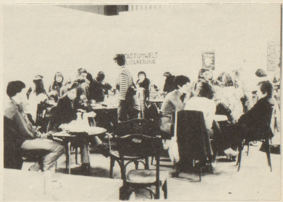
Frauen unter sich

"wir (frauen) wollen nicht bestehende kunststrichungen verändern, da wir uns dort männlichen normen anpassen müssten. andere gruppen (künstler) gehen vom bestehenden aus und können im gegensatz zu uns ihre bedürfnisse und forderungen formulieren. wir nicht. unsere ausgangssituation ist anders. unsere wirklichkeit ist in den bestehenden formen (kunst und gesellschaft) nicht vorhanden, oder manipuliert. Das bild, das von männern in kunst oder werbung von uns gemacht wird, ent-