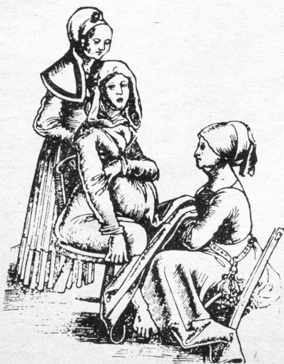
So war es früher! Aber der Mutterschutz in der Schweiz ist immer noch mittelalterlich.