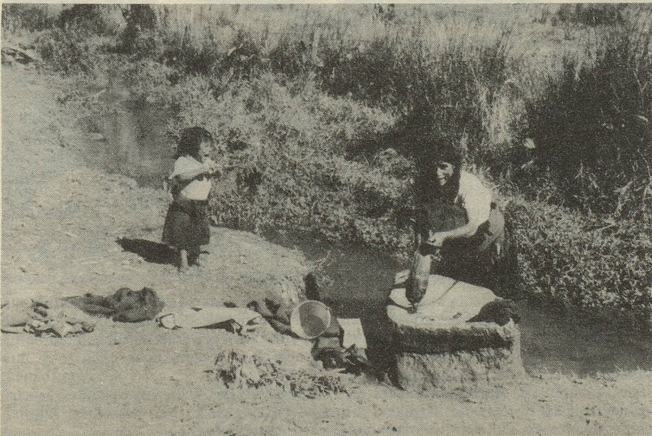
Eine Frau aus Oaxaca, die den Touristen Produkte ihrer traditionellen Webkunst feilbietet.

ökonomische Notwendigkeit für die Arbeit in der Stadt. Weshalb gehen sie also?