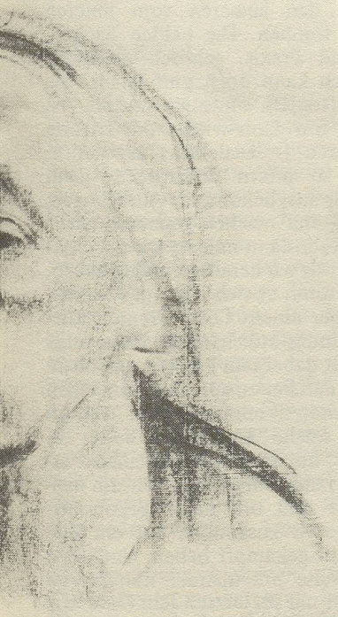
Selbstbildnis von 1920