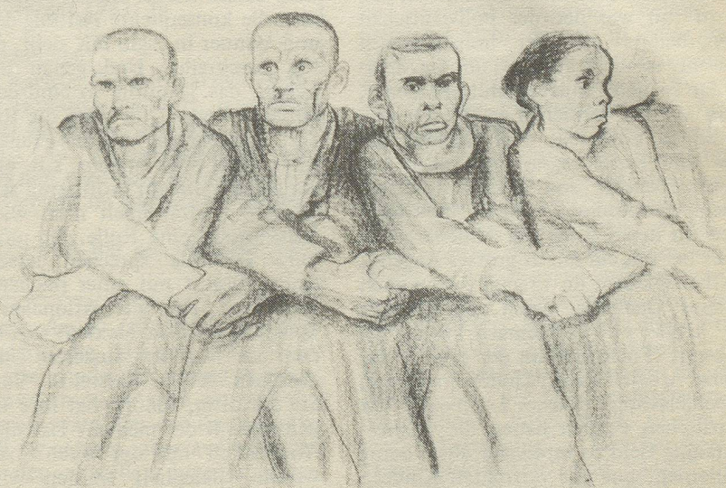
Solidarität „Das Propellerlied“, 1931/32