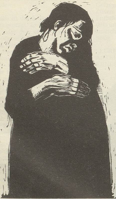
Folge „Krieg“ Blatt 4: Die Witwe, 1922/23