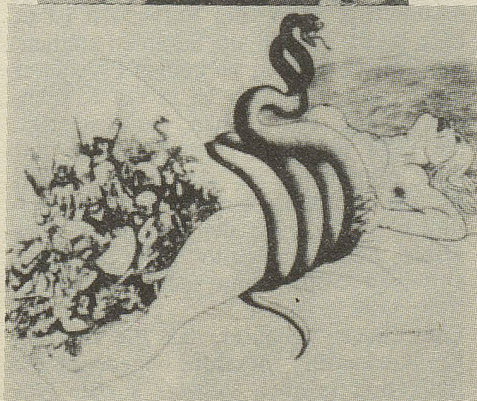
Bilder gegen ein K(l)assengesetz

zurück und lancierte die Fristenlösungsinitiative. Nach weiteren 1 1/2 Jahren Auseinandersetzungen kam sie im September 1977 zur Abstimmung. Mit riesigem finanziellen Aufwand und beispielloser Demagogie gelang es den gegnerischen Kreisen, die Abstimmung knapp zu gewinnen (48,5 Ja, 51,5 Nein). Nun sollte das vom Parlament vorbereitete Indikationsgesetz in Kraft treten, das mit dem vorgesehenen Kontroll- und Bewilligungsverfahren den liberalen Kantonen einen Rückschritt gebracht hätte. Von beiden Seiten (Befürwortern und Gegnern der Abtreibung) wurde das Referendum ergriffen. Im Mai 78 wurde das Indikationsgesetz mit 70% Nein-Stimmen verworfen. Angesichts der starken Unterschiede zwi-