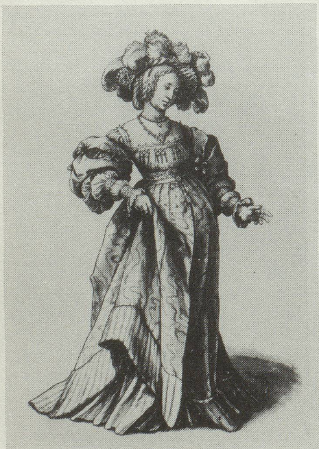
Junge Frau in Basler Tracht von Hans Holbein d.J. (1497/98-1543), Zeichnung aus dem Kupferstichkabinett in Basel.

Im marmornen Schweigen der Museen hängen Bilder von Frauen in schöner Nacktheit und schöner Kleidung. Sie wurden von grossen Künstlern gemalt, die den weiblichen Körper liebten. Merkwürdig, wie wenige von ihnen schwanger sind. (aus: Phyllis Chesler, Über Männer, Hamburg 1979, S.80)