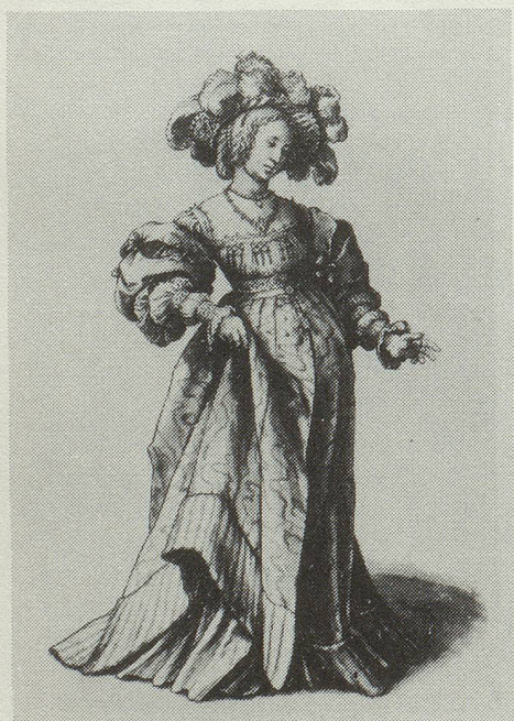
Junge Frau in Basler Tracht von Hans Holbein d.J. (1497/98-1543), Zeichnung aus dem Kupferstichkabinett in Basel.

Merkwürdig, wie wenige von ihnen schwanger sind. (aus: Phyllis Chesler, Über Männer, Hamburg 1979, S.80)