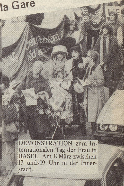
DEMONSTRATION zum Internationalen Tag der Frau in BASEL. Am 8. März zwischen 17 und 19 Uhr in der Innenstadt.