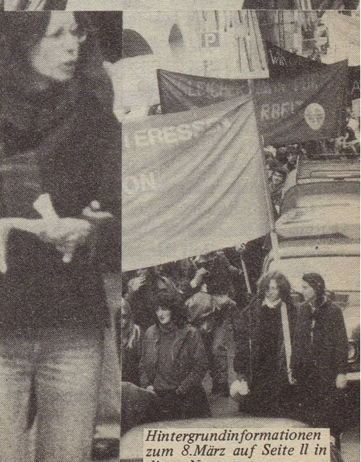
Hintergrundinformationen zum 8. März auf Seite 11 in dieser Nummer.