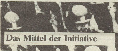
Das Mittel der Initiative

Auch meinen viele Leute, dass im Krieg die Zivilbevölkerung geschützt werden soll. Die Armee im zweiten Weltkrieg wollte sich aber im Falle eines Angriffs von Hitler-Deutschland in die Alpen zurückziehen und die Zivilbevölkerung und 3/4 des Landes ihrem Schicksal überlassen. Der Armee geht es letztlich nur um ihr eigenes Überleben.