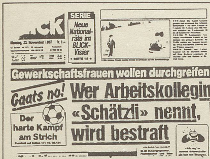
Am 23. November und danach eine volle Woche machte sich der 'Blick' über die Beschlüsse der VPOD-Frauenkonferenz, sexuelle Belästigung scharf