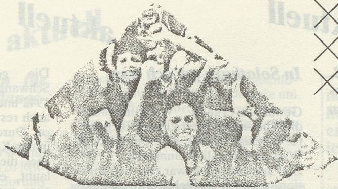
Die Frauen werden zu Hüterinnen der traditionellen Kultur.