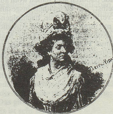
Olympe de Gouges

Zur Hinrichtung einer der Revolutionärinnen, Olympe de Gouges, die von Robespierre so klarsichtig gesagt hatte „ Er schien mir immer ein ehrgeiziger zu sein, ohne Genie, ohne Seele. Ich sah ihn immer bereit, die gesamte Nation zu opfern, um an die Diktatur zu gelangen “, sagte der Wortführer der Kommune, Chaumette, zu vor ihm versammelten Frauen: „ Erinnert euch an die schamlose Olympe de Gouges, die als Erste Frauengesellschaften gründete, die Sorge um ihren Haushalt aufgab, um sich in die Republik einzumischen, und deren Kopf unter dem rächenden Beil der Guillotine fiel! “