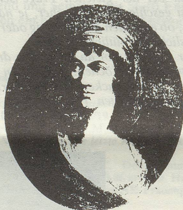
Théroigne de Méricourt

Am 26. August wurden die Menschen- und Bürgerrechte proklamiert, die die Gleichheit aller Menschen und gewisse unveräusserliche Rechte, wie etwa das Recht auf Leben, Freiheit und das