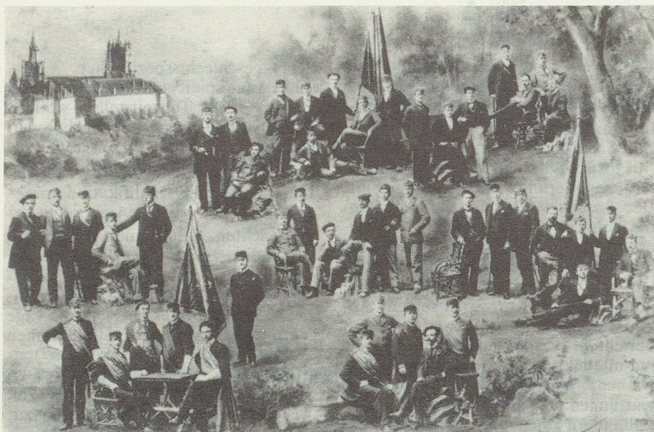
Cherchez la femme ...

Wie kam es dazu, dass von offizieller Seite das Thema „Frauenförderung“ aufgenommen wurde? Ohne Druck seitens der Frauen wäre wohl nichts in dieser Richtung unternommen worden?