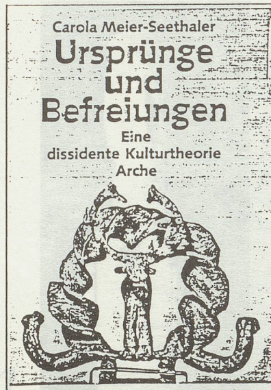
Die keltische Göttin Epona. Relief aus Köngen a. Neckar. Römische Kaiserzeit.

Eine zweite sehr wichtige Quelle sind die archäologischen Zeugnisse. Ich wählte zum Ausgangspunkt meines Buches Catal