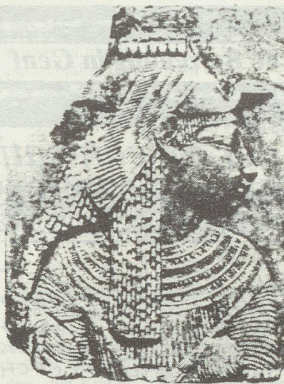
Relief einer Göttin (Isis?) mit Geierhaube. Ägypten, 1. Jh. v. Chr.

Ich fühle mich durchaus als Feministin, nur ist dieser Begriff sehr schillernd, und es lassen sich sehr verschiedene Positionen darunter subsumieren. Im vierten Teil meines Buches versuche ich, klarzustellen, dass sowohl der egalitaristische