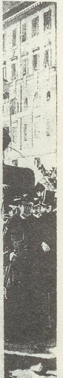
Rechtsanwältinnen – eine Aussicht, bei der Robida erzittert: Schon sieht er die Geschworenen von Erwägungen hingerissen, die mit Beweisführung nichts mehr zu tun haben.

Die (bürgerliche) Frauenbewegung – mit Zentrum in Paris – forderte akademische Bildung für Frauen (Ärztinnen, Juristinnen). Mehr proletarisch