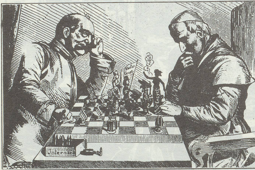
Machtkampf zwischen Staat und Kirche

den Diskussionen, die während des ganzen 19. Jahrhunderts in Frankreich über das Bildungswesen geführt wurden. Diskutiert wurde in erster Linie, wem die Bildung, vor allem die weibliche Bildung, unterstehen sollte: dem Staat oder der Kirche? Wie ein roter Faden durchzieht der Machtkampf zwischen republikanischem Staat und monarchietreuer Kirche die Bildungsdiskussion jener Zeit.