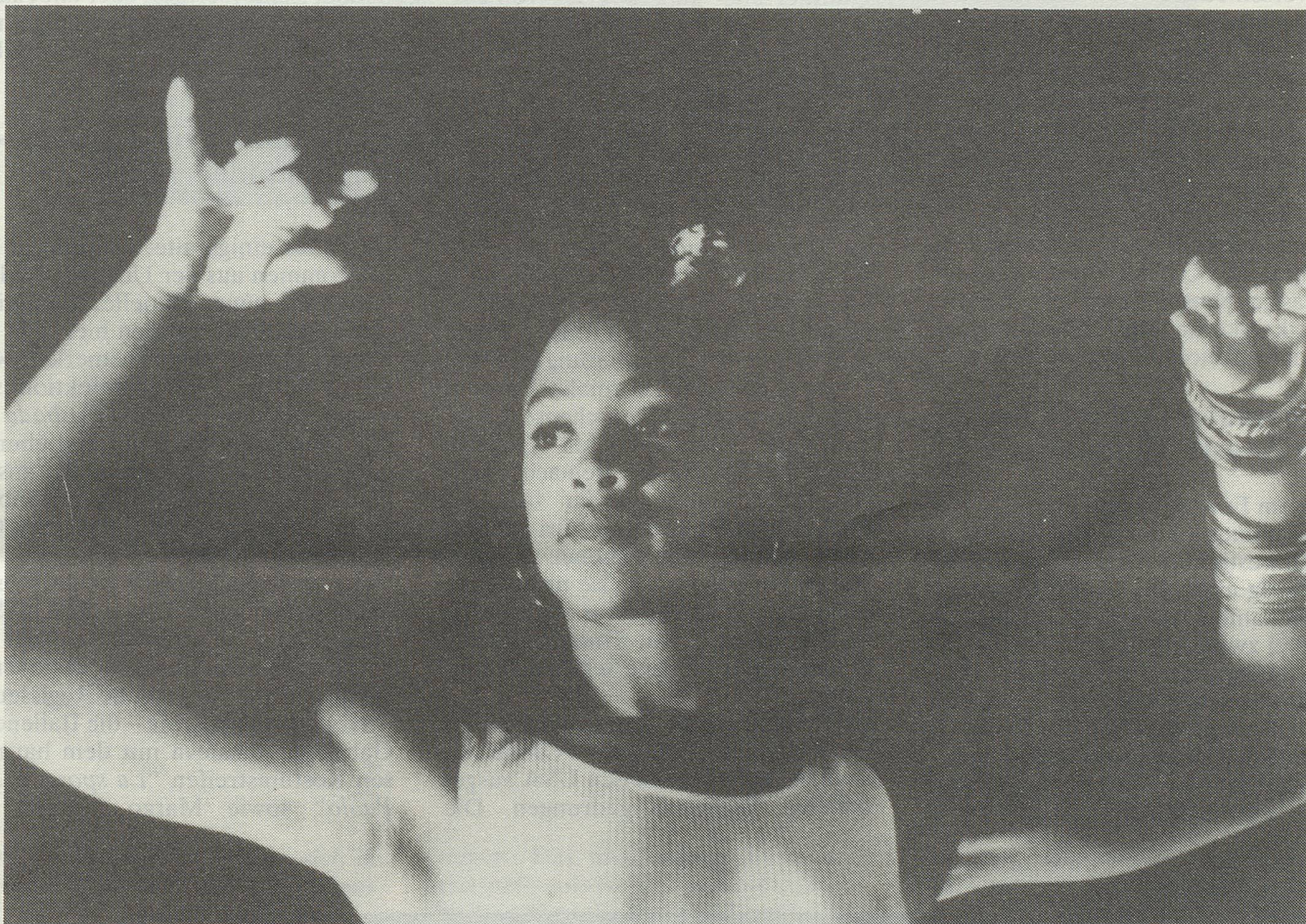
"Angels" von Jacob Berger