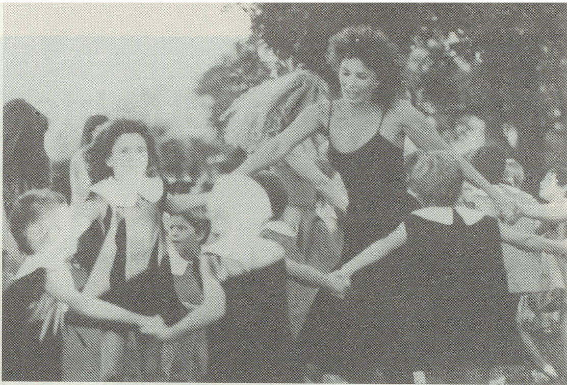
„Kindergarten“ von Jorge Polaco

„Hush-A-Bye Baby“ durften sich im Wettbewerb mit den 16 Männern messen.