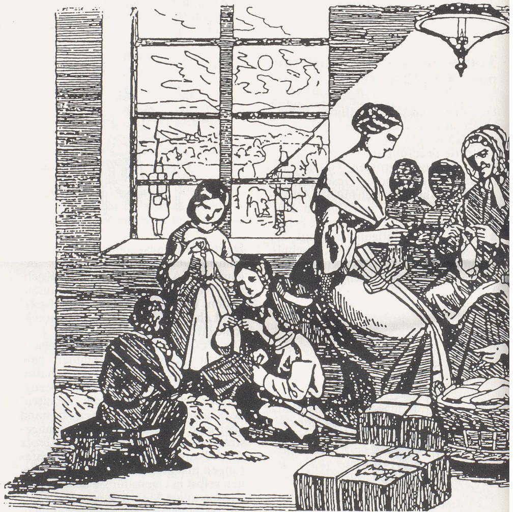
Ein Erinnerungsblatt, den fürs Vaterland strickenden und nähenden schweizerischen Frauen gewidmet. (Postheiri 17.1.1857)

Im Hauswirtschaftsunterricht wurde das Bild eines selbstlosen, arbeitsamen, sparsamen, reinlichen Wesens kreiert, das seine Zeit damit verbrachte, sich für andere aufzuopfern, ihnen