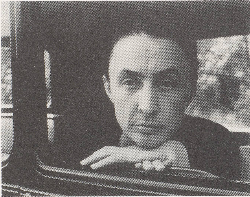
Alfred Stieglitz. Georgia O'Keeffe , 1931