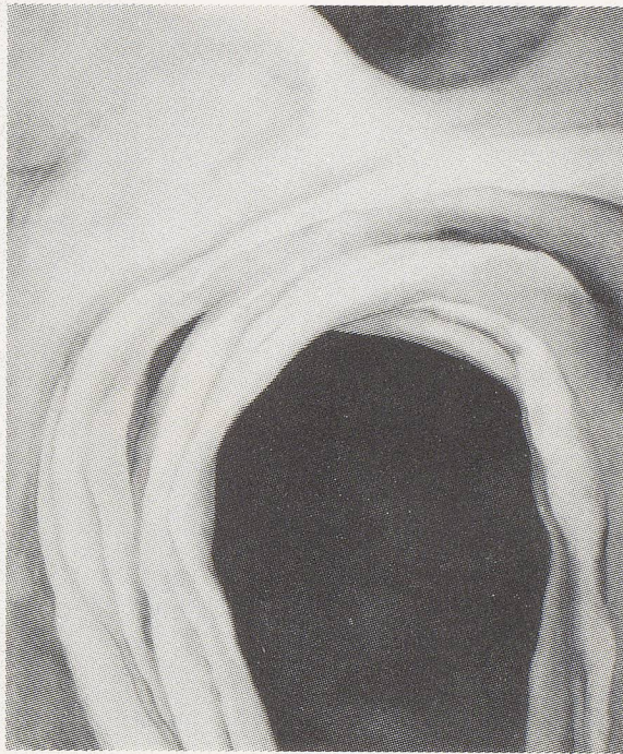
Georgia O'Keeffe. Music—Pink and Blue I , 1919.

um 23 Jahre ältere, inzwischen geschiedene Alfred Stieglitz geheiratet.