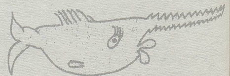
Sägefische aus der Jubiläums-Kampagne «10 Jahre Frauenstimmrecht».

Innerhalb der beiden traditionellen Parteien – der «Vaterländischen Union» und der «Fortschrittlichen Bürgerpartei» – bildeten sich Frauenarbeits-