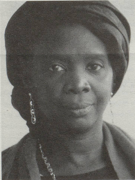
AMINATA SOW FALL