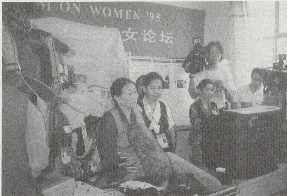
Workshop der Exil-Tibeterinnen

bleiben. An unserem täglichen Mittagstreffen, wo sich die NGO-Vertreterinnen aus der Schweiz austauschen konnten, nahm immer auch eine offizielle Delegierte teil. Inhaltlich ernüchternd deshalb, weil sich die offiziellen Vertreterinnen strikt an die schweizerische Politik gehalten haben. Ich hatte diese Delegation immer als grosse Chance verstanden – wo sonst können schon elf Frauen die Schweiz vertreten! Leider zeigten die Delegierten wenig Mut, insbesondere in Migrationsfragen.