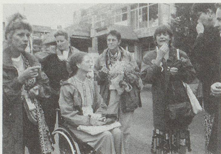
Das CH-NGO-Empfangskomitee wartet auf Bundesrätin Dreifuss.

die Konzentration auf Kultur- und Religionsunterschiede bietet wirtschaftlichen und anderen Interessengegensätzen ein Chance, sich dahinter zu verstecken.