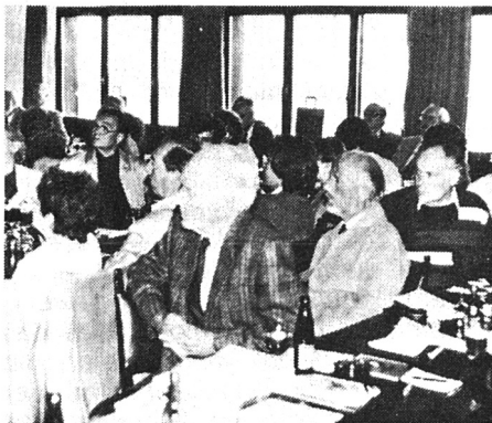
Stimmungsbild im Saal. Reges Interesse.

Wahre Erziehung bestehe darin, die Kinder zum kritischen Denken statt zum Kopfnicken anzuleiten. Immer und überall komme es darauf an, die Zusammenhänge zu erfassen. Stets soll die Frage «Was nützt dir dein Tun?» im Vordergrund stehen. Zwischen Handeln und Bewusstsein bestehe ein wechselseitiger Zusammenhang. Erziehung könne nicht nur zu Hause, sie könne nur in der grösseren Gemeinschaft stattfinden. Als Erziehung zum Egoismus bezeichnete der Redner den geläufigen Ausspruch: «Kannst du was, so bist du was; bist du was, so hast du was.» In der Familie gelte es zu lernen, Konflikte auszutragen. Dabei könnten die Eltern auch von den Kindern lernen. Aufgabe der Freidenker sei es, die Menschen zum Denken anzuleiten. Nur ein freidenkender Mensch könne als freier Mensch leben.