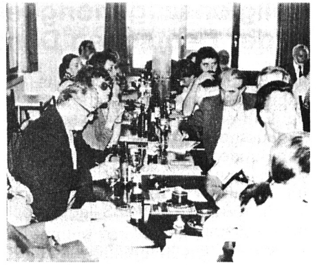
Stimmungsbild aus dem Tagungssaal.