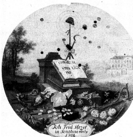
Christian Andreas Eberlein, Schützenscheibe auf die Französische Revolution, 1792.