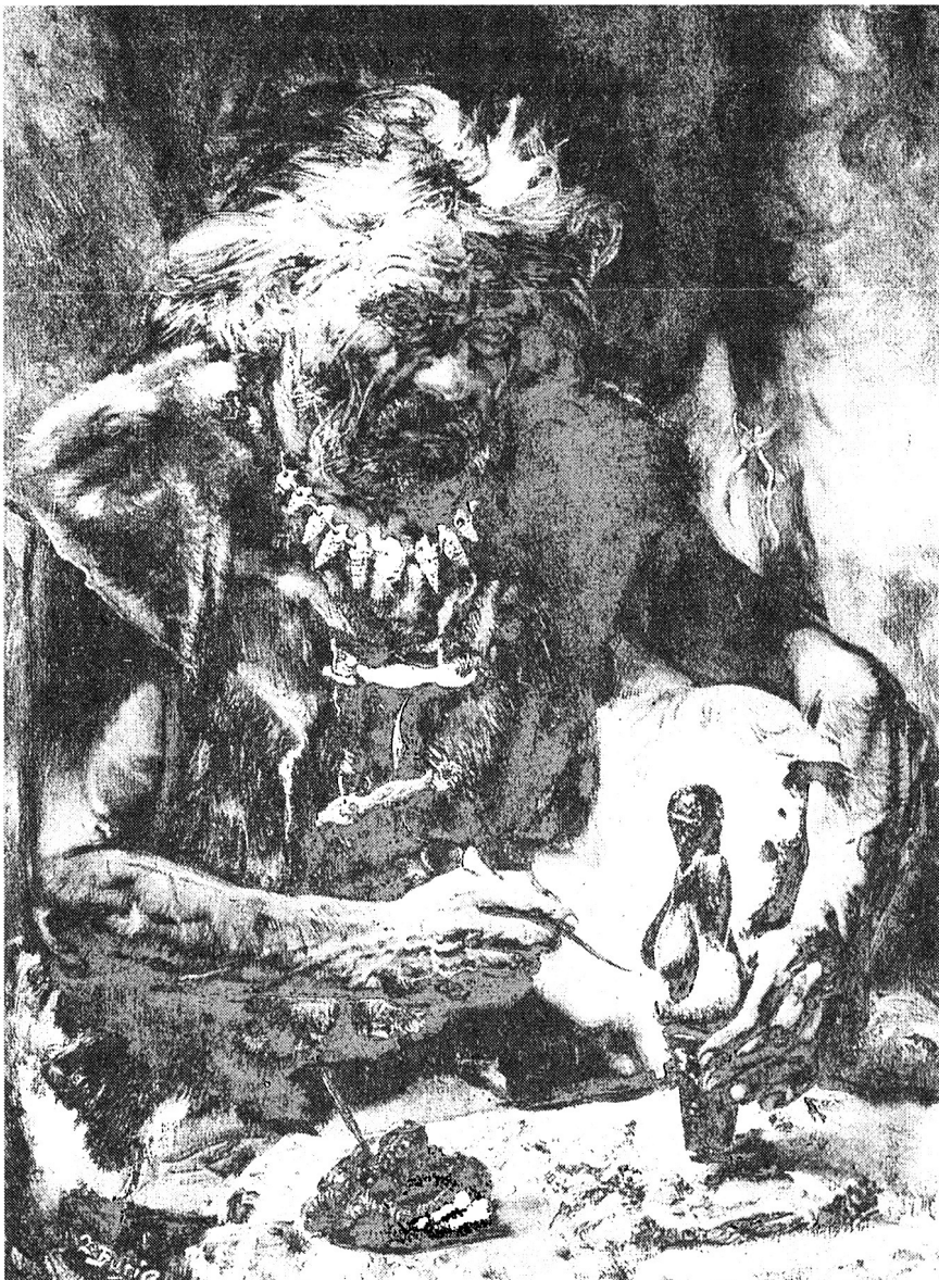
Ein Mann schnitzt, vor 25 000 Jahren, eine Frauenstatuette.

Bei den Römern herrschten zu Beginn der christlichen Jahreszählung nicht die Väter, sondern die Söhne. Nietzsche ruft aus: « O weh, nie sank die Welt so tief; Rom sank zur Hurenbude, und Gott ward Jude! » Wieder einmal hatte er den Nagel auf den Kopf getroffen. Ähnlich wie die Söhne heute unter dem horizontalen Leben ihrer Mütter leiden, hatten auch zur Zeit der römischen Promiskuität die leidenden Söhne Macht über ihre Mütter, ihr unschuldiges Leiden und ihr Hass entzog die Frauen immer mehr dem Verlangen ihrer Liebhaber. Je bunter es die Römer trieben, um so mehr ging die Macht über die Frauen von den Vätern auf die leidenden Söhne über, vom Kaiser auf Jesus Christus. Mit ihrem Gekreuzigten verkündigten die Evangelisten den Römern: Das, Leute, ist die wahre Macht in Rom. Sie gingen sogar soweit, ihm eine Jungfrau als Mutter anzudichten. Das war ein Volltreffer ins Herz des römischen Impe-