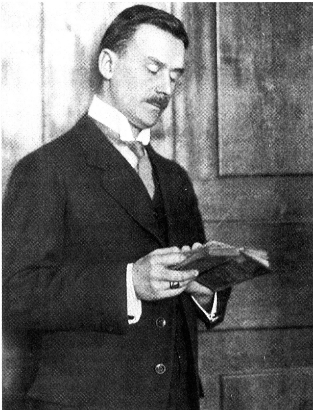
Nobelpreisträger Thomas Mann (Aufnahme ca. 1918)

Grässliche Welt, die nun nicht mehr ist – oder doch nicht mehr so sein wird, wenn das grosse Wetter vorüberzog! Wimmelte sie nicht von dem Ungeziefer des Geistes wie von Maden? Gor und stank sie nicht von den Zersetzungsstoffen der Zivilisation ... Wie hätte der Künstler, der Soldat im Künstler nicht Gott loben sollen für den Zusammenbruch einer Friedenswelt, die er so satt, so überaus satt hatte! Krieg! Es war Reinigung, Befreiung, was wir empfanden, und eine ungeheure Hoffnung ... Eine Utopie des Unglücks stieg auf.»