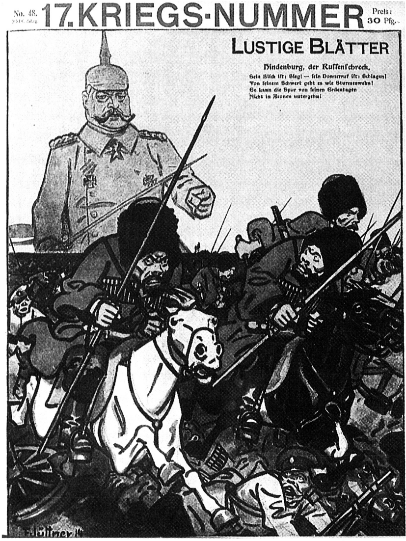
Hindenburg, der Russenschreck Sein Blick ist: Sieg! – sein Donnerruf ist: Schlagen! Von seinem Schwert geht es wie Sturmeswehn! Es kann die Spur von seinen Erdentagen Nicht in Äonen untergehn!