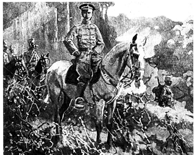
«Der schöne Soldat», Kinderbuch von 1915

ein Feld weiss und reif zu einer Geistes- ernte liegt vor uns!» (...) Im Jahresbericht für 1918, im März 1919 geschrieben, ist bezeichnenderweise von einer «Kriegs- niederlage» nirgendwo die Rede. Man ahnt aus den unbestimmten Formulier- ungen nur, was passiert war. Erschüttert fragten sich die Pfarrer, wie Gott «so et- was» habe zulassen können.