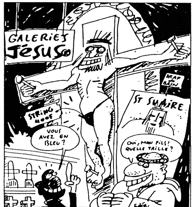
Aus der satirischen Zeitschrift «Barre à Mine» n° 3

En France, l'AGRIF (proche du Front national) utilise régulièrement la loi antiraciste de 1972 (modifiée en 1990) pour combattre, avec un certain succès, les racismes «anti-français» et «antichrétien». Dans les attaques contre «Barre à Mine», on retrouve les grandes lignes de l'argumentation de l'art. L 227-24 réprimant le prétendu «blasphème». Le projet de loi suisse comporte un article interdisant toute attaque globale contre une religion. Comme l'écrit Bernard Joubert: «La censure dessert les meilleures causes.»