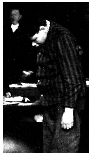
Rudolf Augsteins Einzeltäter: Marinus van der Lubbe

«Jedem Deutschen ist klar, dass die Männer, denen das deutsche Volk seine Errettung vor dem bolschewistischen Chaos verdankt und die es einer inneren Erneuerung und Gesundung entgegenführen, einer solchen verbrecherischen Gesinnung, wie sie diese Tat verriet, niemals fähig waren. Der Senat hält es daher auch für unter der Würde eines deutschen Gerichts, auf die niedrigen Verdächtigungen, die in dieser Beziehung von vaterlandslosen Leuten in Schmähbriefen (Braunbuch) im Dienste einer Lügenpropaganda ausgesprochen sind, die sich selbst richtet, überhaupt nur einzugehen.»