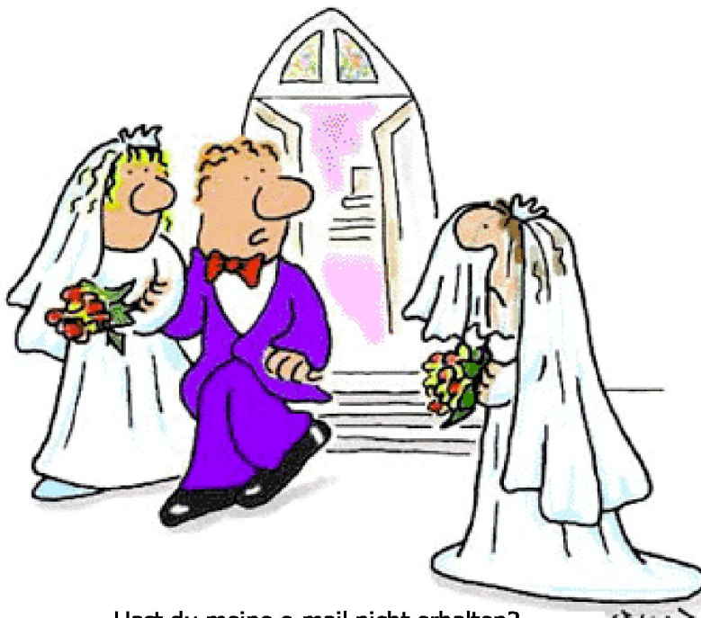
Hast du meine e-mail nicht erhalten?

Informationen auf dem FVS-Zentralsekretariat oder auf dem Internet: http://www.ihcu.org/1HN/current/Long_Walk_for_Humanism