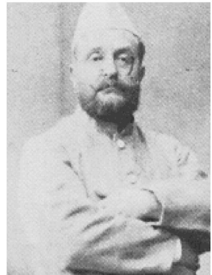
Georg von Schönerer