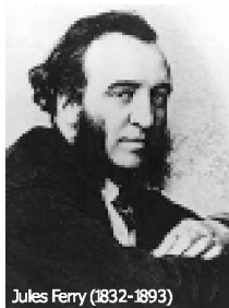
Jules Ferry (1832-1893)

I due grandi riferimenti storici sono stati, il discorso di Victor Hugo al Senato contro la legge Falloux (1850) e la "Lettre aux enseignants des