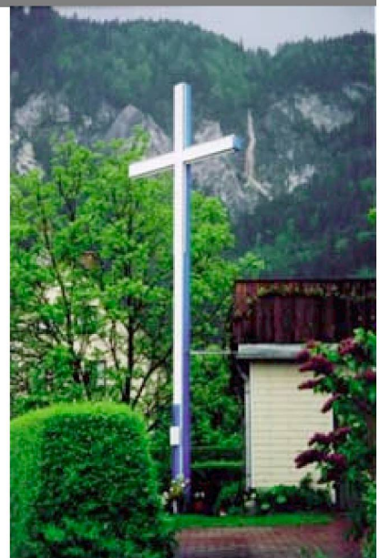
eines der rund 7'000 "Liebeskreuze" in Europa

Es mutete eigenartig an, wenn der Bundesrat von der "Bedeutung der Kirchen in der Wertediskussion" der Gesellschaft spricht. Natürlich, faktisch haben die Kirchen eine Bedeutung, deshalb müssen sie vor allem in die Pflicht genommen werden. Einen besonderen Beitrag haben sie aber – das zeigen die jüngere und ältere Geschichte – nicht geleistet, im Gegenteil: Wie Leuenberger bemerkt, haben gerade in den jüngsten Konflikten die Kirchen und die Religionsführer einmal mehr ihre unheilvolle Rolle als göttliche Legitimationsverordner für kriegerisches Handeln demonstriert. Von solchen Leuten ist kein Beitrag zur