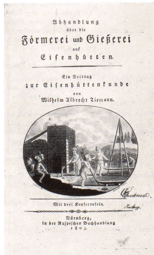
Titelseite eines Werkes aus der Bibliothek J. C. Fischers